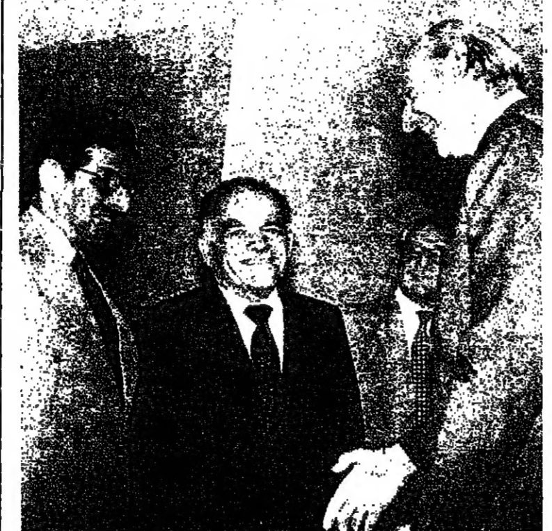
وزير الخارجية اسحق شيرون يودع امس في مطار تل أبيب وزير الخارجية المصري كمال حسن علي

القدس - يواصل رئيس الدولة السيد اسحق رابون ، اتصالاته تمهيداً للزيارة الرسمية التي سيقوم بها لمصر في نهاية شهر أكتوبر القادم . وقد اجتمع الرئيس رابون مع شخصيات زارت مصر مرات عديدة في نطاق مهام رسمية لها كما اجتمع مع اساتذة علميين على الحضارة المصرية .